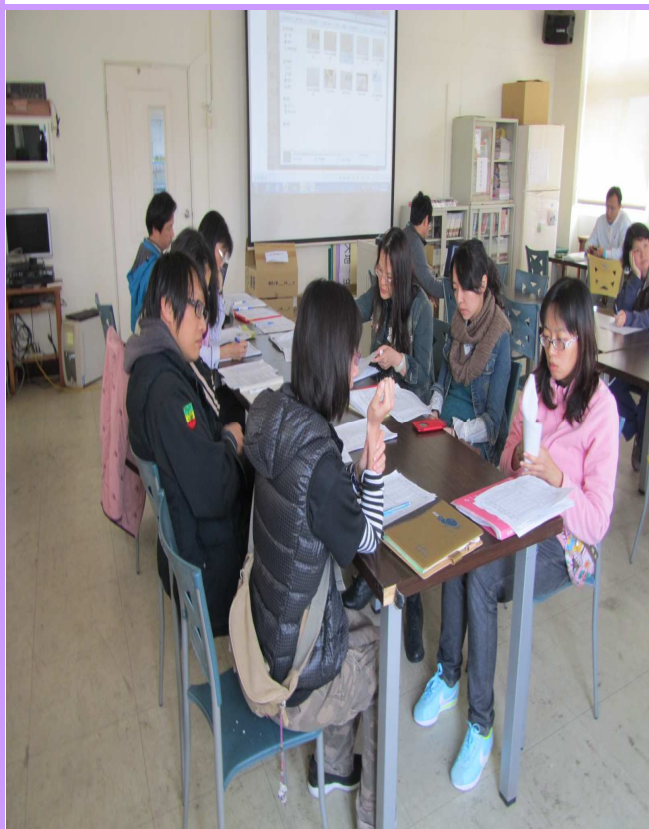
學年主任針對健促計劃相互討論