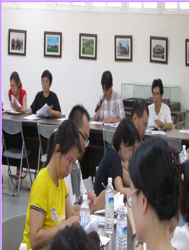
校長主持全校教職員出席教師夕會