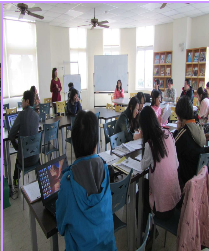
衛生組長說明健促實施計劃及配合事項