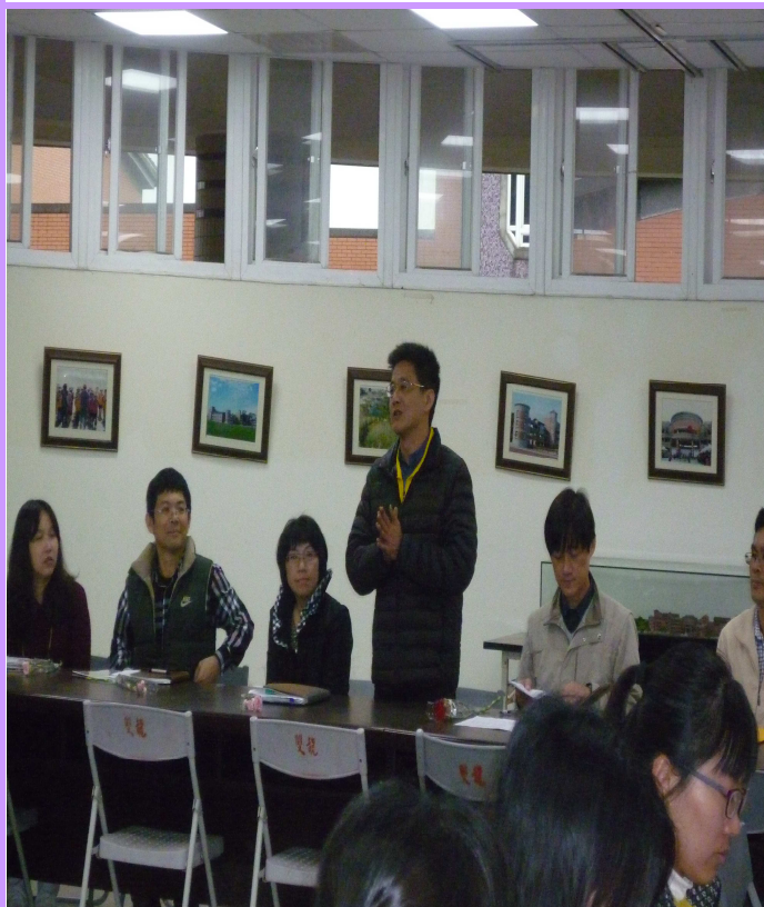
邀請家長代表參與教師夕會瞭解校內事務