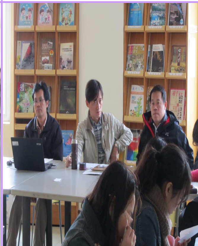
王主任回應學年提問