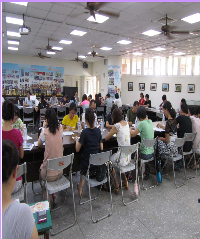
全校教師每週二在校史室召開教師夕會