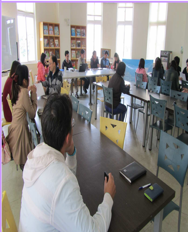
校長主持健促小組成員出席行政會議